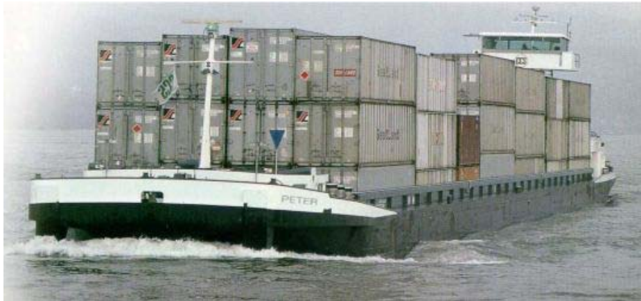
Fig 1. Inlandspråm med containerlast.