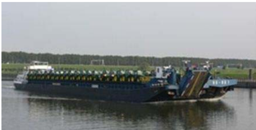
Fig 5. Inlands RoRo-pråm

Med fyra fartyg är kapaciteten 67 200 trailers per år, dvs. knappt tio procent av den nuvarande trailertrafiken på Göteborgs hamn.