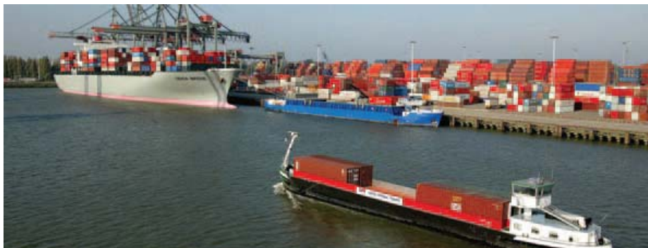
Fig 2. havsgående fartyg och inlandspråm i dubbelklassad hamn

EU-s nya TEN-T satsning innehåller möjligheten att identifiera s.k. "Core Networks" och "Comprehensive Networks". Åtminstone Vänerregionen har möjlighet att klassas som "Comprehensive Networks" och därmed få en särskild status som utvecklingsområde.